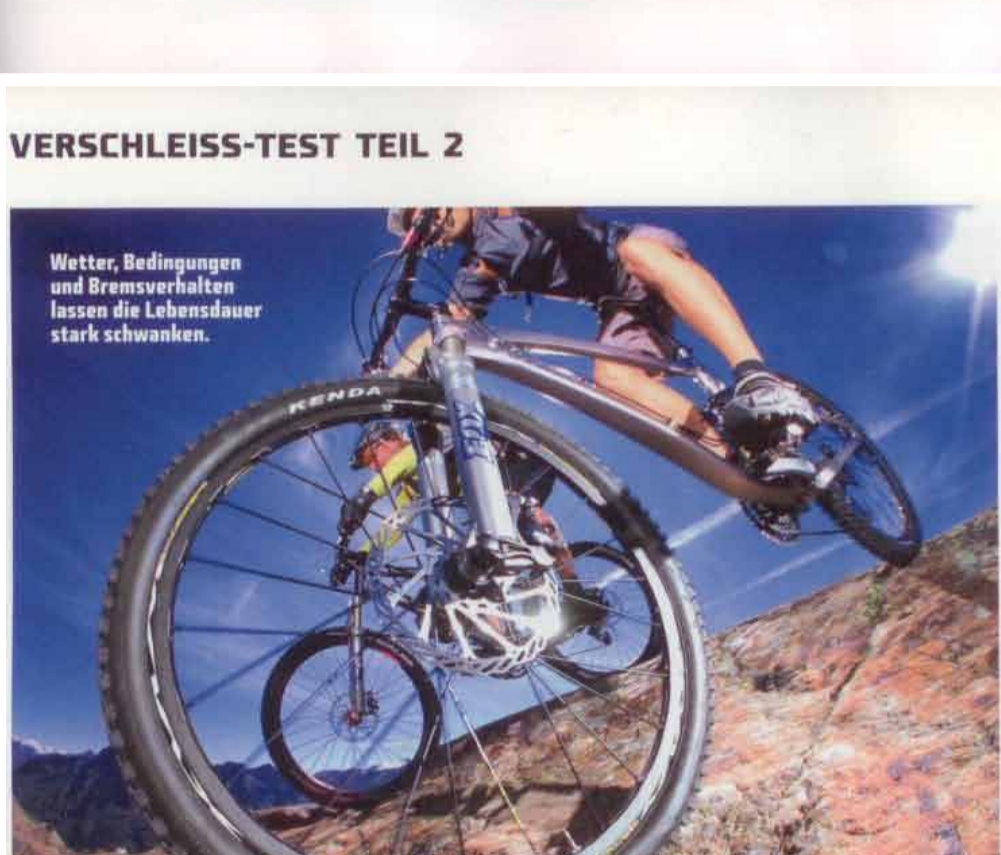
Wetter, Bedingungen und Bremsverhalten lassen die Lebensdauer stark schwanken.