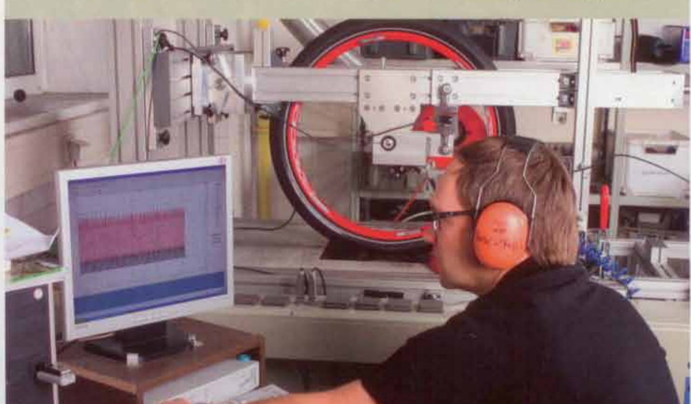
Keine Gnade auf dem Prüfstand: Drei Mal 1000 Bremsungen pro Belag sind die Basis des Verschleißtests.

1. VERSCHLEISS Nach dem Einbremsen gemäß Herstellervorgabe wurden mit jedem Belag insgesamt 1000 Bremsungen durchgeführt, in Zyklen von 200 Bremsungen zu je einer Sekunde. Dabei betrug die Bremsleistung immer rund 350 Newton. 2. BREMSLEISTUNG Nicht jeder Belag liefert konstante Bremsleistung, das haben die Messungen gezeigt. Um die Bremsleistung möglichst konstant bei 350 N zu halten, wurde die Handkraft mittels Gewichten angepasst, Schwankungen so ausgeglichen.